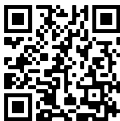
Videó használati utasítás QR-kódja